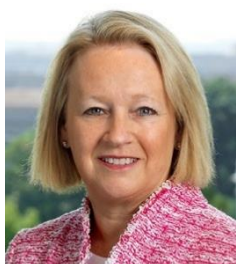
メアリー・シャピロ TCFDタスクフォース事務局 ブルームバーグ 公共政策担当副会長・特別顧問