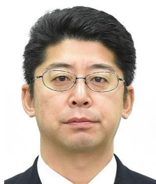
中村 康治 日本銀行 国際局兼企画局 審議役、気候連携ハブ長