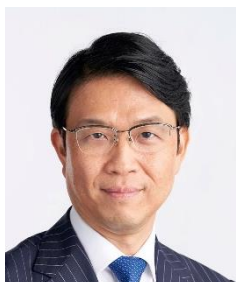
水野 弘道 革新的ファイナンス及び 持続可能な投資に関する 国連事務総長特使